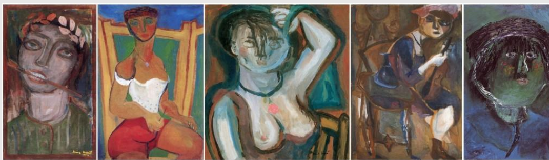
Anna Margit festményei: Önarckép (1937); Önarckép fürdőruhában (1939); Fésűs önarckép (1940 körül); Önarckép (1946); Önarckép (1966)