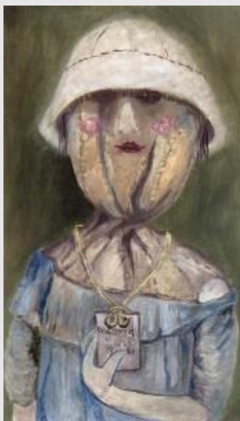
Anna Margit: A dögcédula, 1981

Amikor 1988-ban izraeli utazásom után elmentem Anna Margithoz, ő már a dachau kiállításra készült. Mire eldöntöttem, hogy belekezek az Emlékkavicsok – Holocaust a magyar képzőművészetben 1938–1945 közöttkönyv anyaggyűjtésébe, megírásába, Anna Margit már nem élt. Ámos Imréről hosszan írtam, viszonylag sok illusztrációt közöltünk 1940 és 1944 között a munkaszolgálatok során készült munkáiról. Azt gondolom, hogy ez rendben van. Ám az nincs rendben, hogy Anna Margitról csak Ámossal együtt írtam, és nem kapott önálló részt a Túlélők fejezetben. Hiányolom, hogy nem készült egy olyan záró rész a 2006-ban megjelent könyvben, amely a holokauszt-túlélők e témához kapcsolódó műveit mutatná be. Ebben Anna Margitnak kiemelkedő szerepe lenne ( Milliók egy miatt , 1977; Az elkésett Messiás , 1985; A dögcédula , 1981; Itt nincsenek pillangók , 1983).