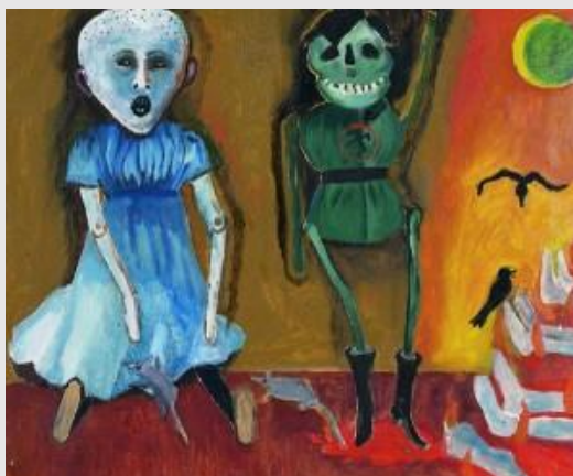
Anna Margit: Csak azt tudnám feledni... (1980)